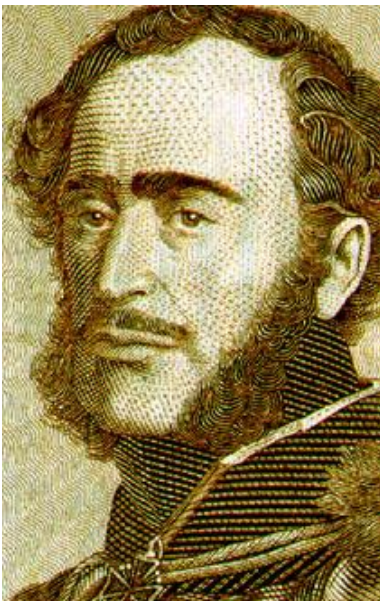
Széchenyi István (1791-1860)

A hivatalos indoklás szerint az „ Országgyűlés a tudomány társadalomban betöltött szerepét kiemelkedően fontosnak, a tudomány művelése és fejlesztése érdekében végzett tevékenységet elismerésre és kiemelkedő támogatásra méltónak tartja ” ezért e napot a 2003. évi XCIII. törvénnyel a magyar tudomány ünnepévé nyilvánította.