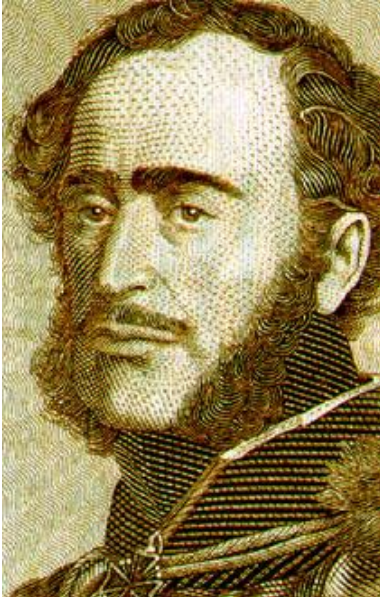
Széchenyi István (1791-1860)

A hivatalos indoklás szerint az „ Országgyűlés a tudomány társadalomban betöltött szerepét kiemelkedően fontosnak, a tudomány művelése és fejlesztése érdekében végzett tevékenységet elismerésre és kiemelkedő támogatásra méltónak tartja ” ezért e napot a 2003. évi XCIII. törvénnyel a magyar tudomány ünnepévé nyilvánította.